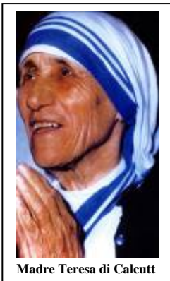
Madre Teresa di Calcutta

Il territorio è prevalentemente montuoso essendo in larga parte costituito dalle propaggini meridionali della catena