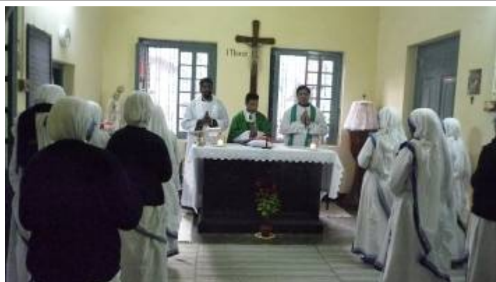
7 Febbraio 2009. Concelebrazione nella casa Generalizia di Madre Teresa in Calcutta. Al centro, Celebrante, il Vicario Regionale, a destra il Direttore della Comunità di Miao,

Lo stato di Arunachal Pradesh fa parte della Federazione indiana e ha una superficie di Km 2 83.700 ed una popolazione di 1.093.000 abitanti di cui il 65% è tibetana. E' abitato da 65 tribù diverse, tutte discendenti dai mongoli. Lo stato, posto nell'estremo Nord-Est dell'India, confina a Nord con la regione cinese del Tibet, ad Est e a Sud-Est con la Birmania, a