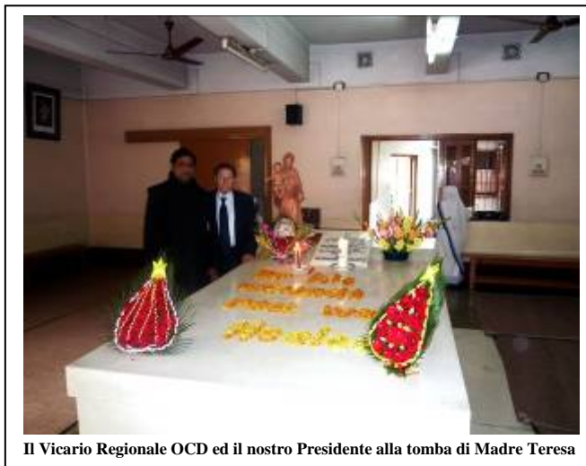
Il Vicario Regionale OCD ed il nostro Presidente alla tomba di Madre Teresa

La regione dell'Assam è importante per le estese piantagioni di tè monopolizzate dai grandi proprietari terrieri e sembra essere, anche, la terra d'origine di alcune delle varietà di peperoncino in lizza per il primato mondiale.